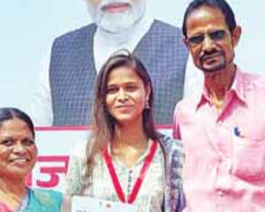
अपनी मेहनत, लगन और प्रतिभा के